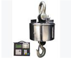
Cân treo OCS-SW Xem chi tiết >>